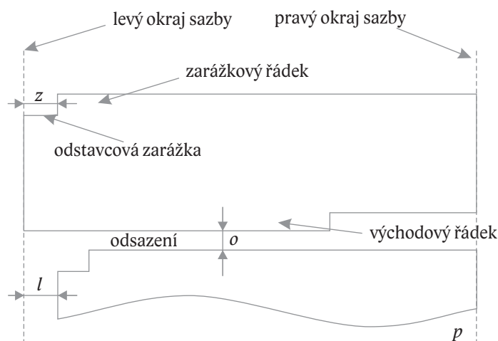
Obrázek 7.1: Parametry odstavcové sazby

Odstavec je považován za základní prvek dokumentu. Jeho tvar a vzájemné vizuální oddělení má zásadní vliv na celkový vzhled a působení dokumentu na čtenáře. Způsob sazby je ovlivněn několika parametry, jejichž vhodné hodnoty uvedeme (viz též obr. 7.1).